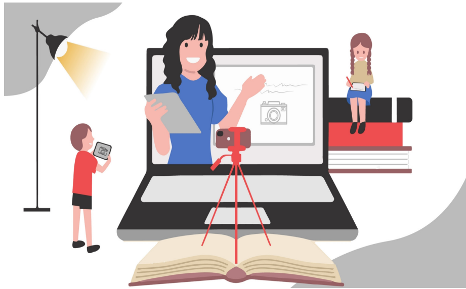
ภาพ 2 การพัฒนาครูในยุคชีวิตวิถีใหม่