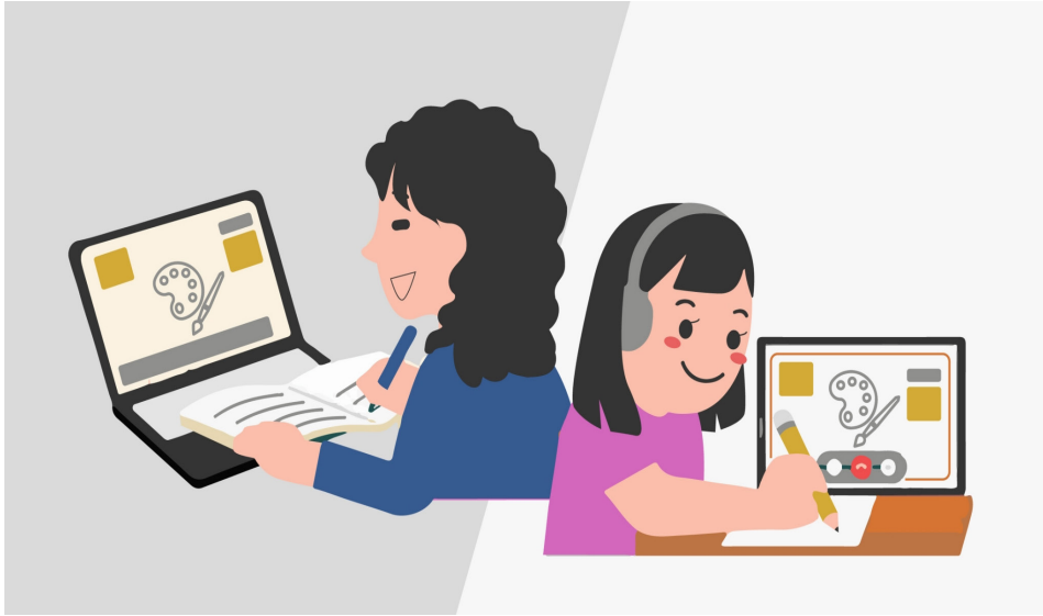
ภาพ 1 การจัดการเรียนรู้ยุควิถีชีวิตใหม่ (New Normal)